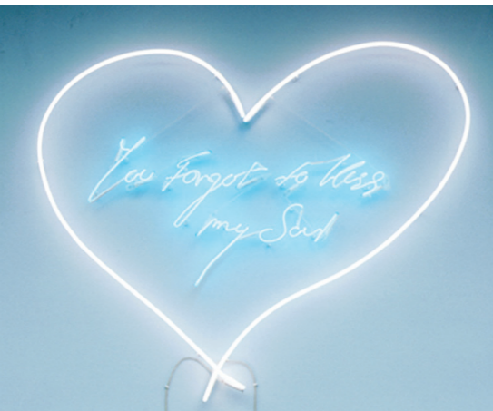
You forgot to kiss my soul Tracey Emin, 2001, neon, collectie Stedelijk Museum Amsterdam e.a.

Haast ongemerkt kunnen we vergeten om elkaars ziel wakker te kussen en misschien erger nog: om onze eigen ziel wakker te kussen. Dit is waar het in ons werk ten diepste over gaat. Beide bewegingen zijn nodig om effectief te begeleiden.