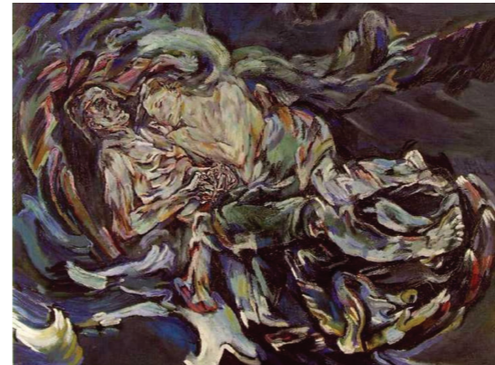
Oskar Kokoschka, Bride of the wind, 1913, olie op doek, 181 x 221 cm, Kunstmuseum Basel

en virtuele kunst tot eigen kunstwerken. Francien Bruggink beschreef haar per- soonlijke reis tijdens de opleiding aan de hand van de sculptuur die zij maakte, geïnspireerd op de zeventiende-eeuwse beeldhouwer Bernini.