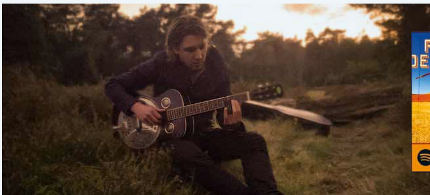
Reflejos De La Muerte , mijn buiging voor de dood.